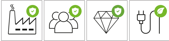
ANLAGENSCHUTZ PERSONENSCHUTZ PRODUKTESCHUTZ ENERGIESPAREN